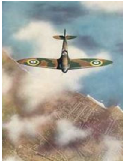
Le Spitfire et sa silhouette très caractéristique (aile elliptique)

Malheureusement, R.J. Mitchell ne devait jamais voir voler le futur chasseur F 5/34, qui dans la RAF, prit le nom de "Spitfire". Mitchell dessina un dernier modèle d'avion, dont la spécification était le B 12/36. C'était un bombardier quadrimoteur, le Supermarine modèle 316. Cet ingénieur si talentueux mourut le 11 juin 1937 à l'âge de 42 ans.