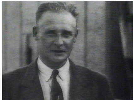
Reginald Joseph Mitchell

La compagnie le suivait de très près, et en 1919 il fut nommé chef dessinateur, puis responsable du bureau d'études...Il avait 24 ans! Son nom fut vite très connu. Si on le surnommait alors "Billy", son vrai nom était Réginald Joseph Mitchell.