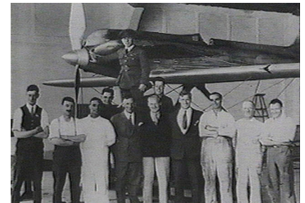
L'équipe Supermarine de la coupe Schneider devant le S5 (R.J. Mitchell est au centre)

Ensuite, l'Italie gagna, puis ce furent les USA, et en dernier, ce fut le Supermarine S-6B qui remporta la victoire finale en 1931 pour le compte de la Grande Bretagne. La coupe Schneider était terminée.