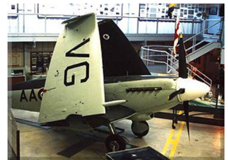
Seafire du Naval Museum of Alberta