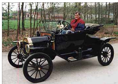
Ford modèle T de 1912 d'un heureux collectionneur Belge