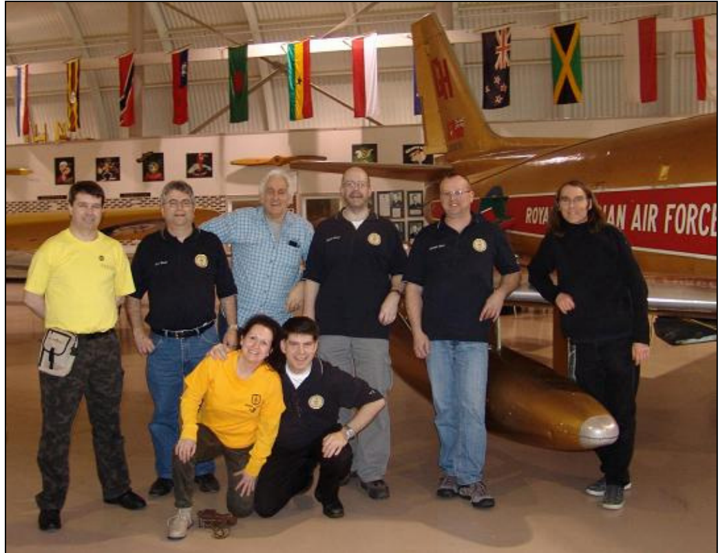
La gang de Montréal!

Ce n'est que peu dire en disant que j'ai hâte à l'année prochaine, c'était bon à s'en lécher les doigts!!