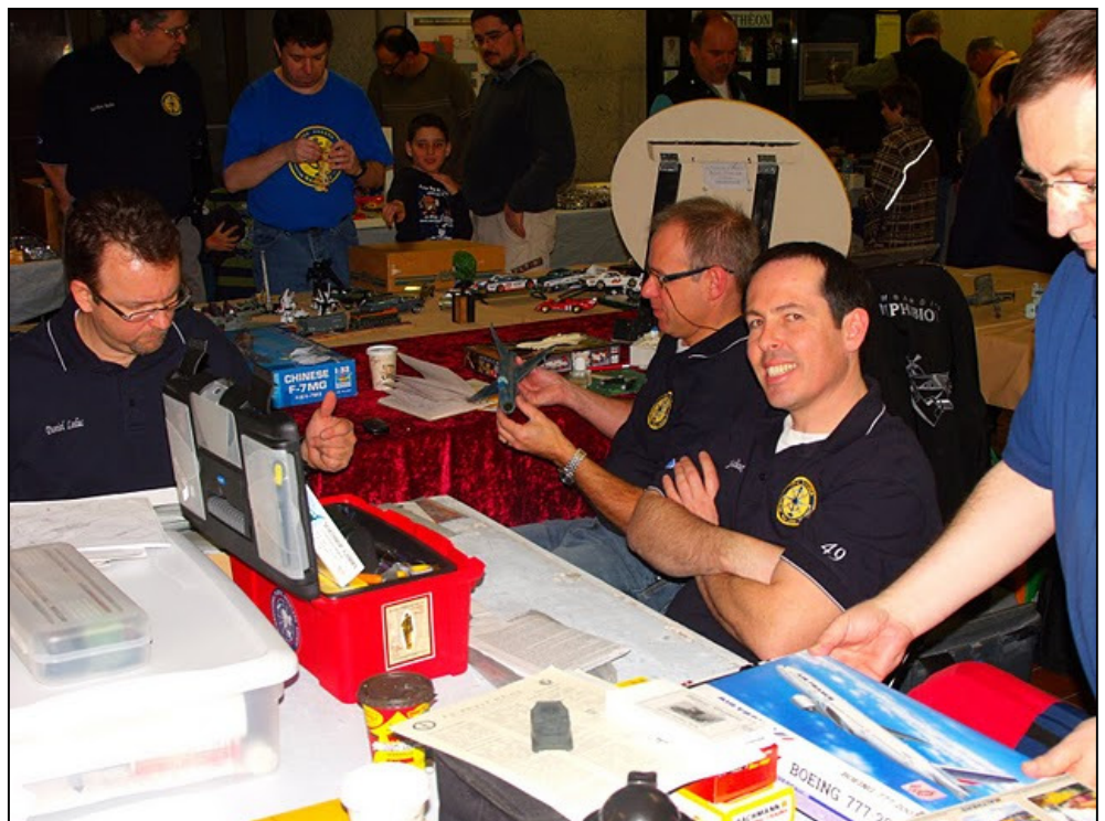
La Gang en action...