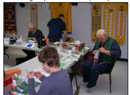
L'intérieur du local