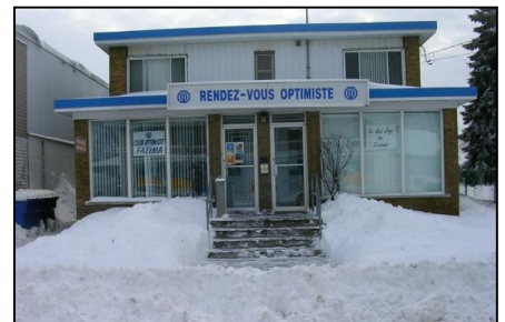
Photo du local, MAIS il n'y aura pas de neige... (du moins on l'espère!!!)

http://maps.google.ca/maps?f=q&source=s_q&hl=fr&qeocode=&q=2250+limoges,+longueuil&ie=UTF8&hq=&hnear=2250+Rue+Limoges,+Longueuil,+Qu%C3%A9bec+J4G+1P6&ll=45.57518,-73.476562&spn=0.007285,0.013797&z=16