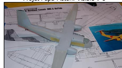
Projet semi-scratch: Buffalo 1/72