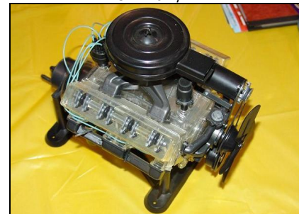
Projet Papa-Fiston: Visible V-8